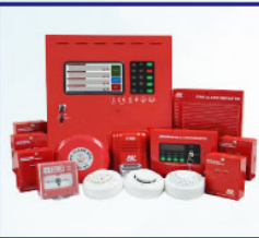
Fire Alarm Control Panel