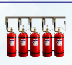
Fire Suppression System