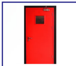
ASICO Fire Door