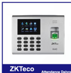
ZKTeco Attendance Device