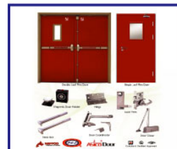
UL Listed Fire Door & Accessories