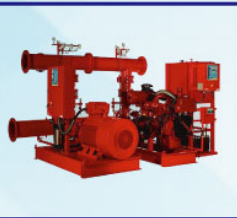
Fire Pump Set