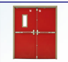
NAFFCO Fire Door